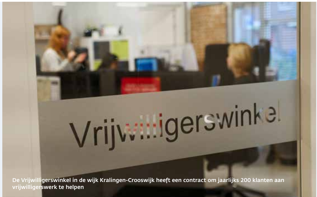
De Vrijwilligerswinkel in de wijk Kralingen-Crooswijk heeft een contract om jaarlijks 200 klanten aan vrijwilligerswerk te helpen

structuur, werkervaring, gezondheid en betekenisgeving. De tegenprestatie is geen straf, maar moet mensen helpen in hun persoonlijke ontwikkeling.