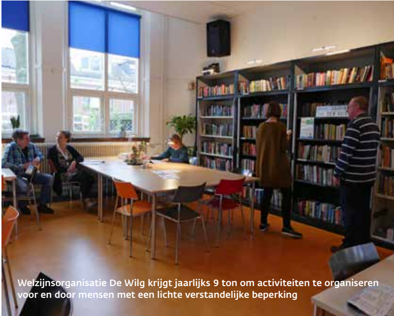
Welzijnsorganisatie De Wilg krijgt jaarlijks 9 ton om activiteiten te organiseren voor en door mensen met een lichte verstandelijke beperking