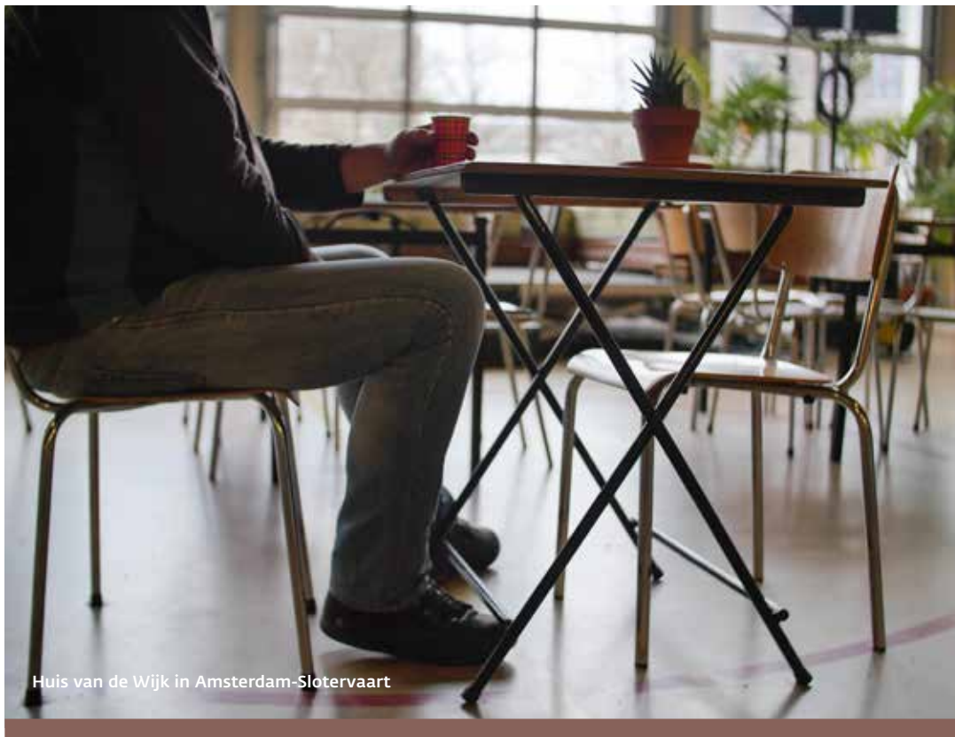
Huis van de Wijk in Amsterdam-Slotervaart