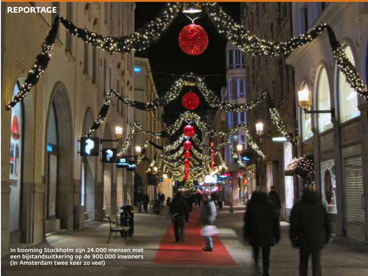
In booming Stockholm zijn 24.000 mensen met een bijstandsuitkering op de 900.000 inwoners (in Amsterdam twee keer zo veel)

aan de orde. Dat begrijpt Ploog. 'In het verleden waren er zelfs 1-euro-banen in de kantine van het regionale arbeidsbureau.' De banen moeten nu echt additioneel zijn. 'Als ze er niet zouden zijn, moet de tent (verzorgingshuis, school etc.) gewoon door kunnen draaien.' Zou je mensen vrijwilligerswerk kunnen laten doen met behoud van uitkering, zoals in Nederland? Ploog is verbaasd. Vrijwilligerswerk? Dat is veel te hoog gegrepen voor de 1-Euro-Jobbers. Vrijwilligerswerk wordt in Duitsland vooral gedaan door 'gegoede burgers', met een betaalde baan. Het zijn vaak vrijwilligers die 1-Euro-Jobbers begeleiden, aldus Ploog. Bovendien: wat geeft meer eigenwaarde? Een baan toch zeker!