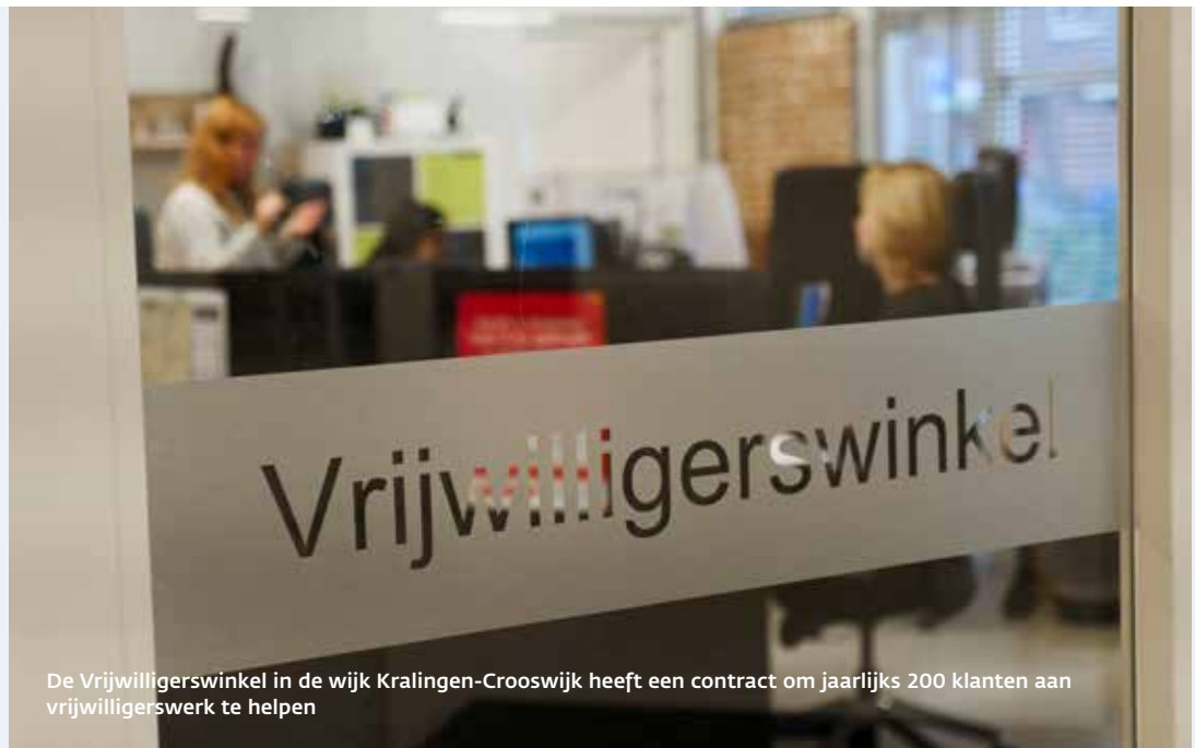
De Vrijwilligerswinkel in de wijk Kralingen-Crooswijk heeft een contract om jaarlijks 200 klanten aan vrijwilligerswerk te helpen

structuur, werkervaring, gezondheid en betekenisgeving. De tegenprestatie is geen straf, maar moet mensen helpen in hun persoonlijke ontwikkeling.