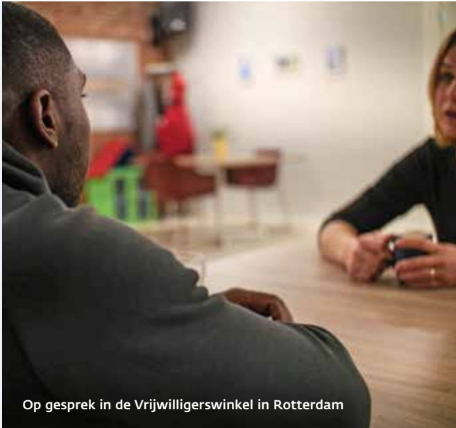
Op gesprek in de Vrijwilligerswinkel in Rotterdam